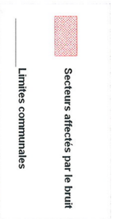
Annexe 3 CARTE DES SECTEURS AFFECTÉS PAR LE BRUIT