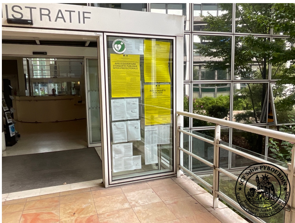
3. (20/07/2022 10:38:05)